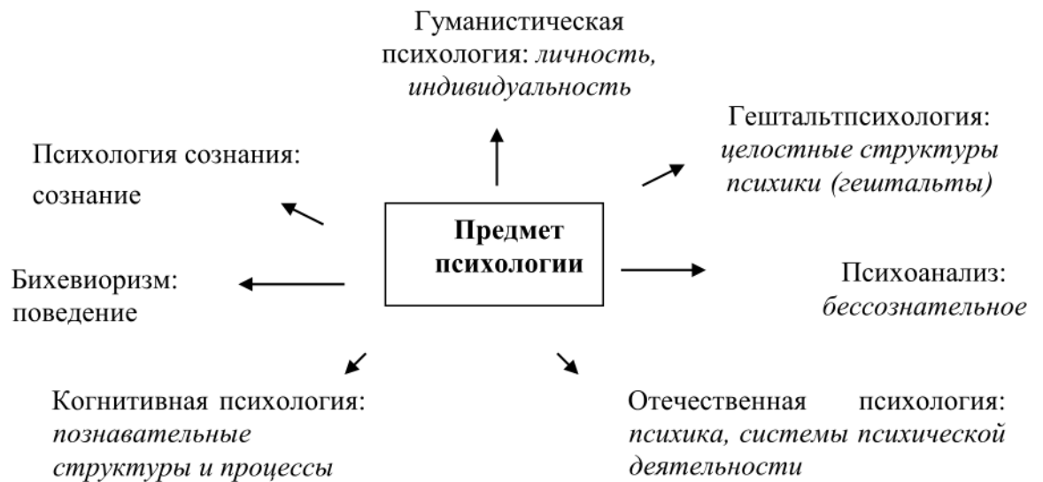
Рис. 4. Полипредметность психологии

Предметом исследования является сторона (свойство, функция и т.п.) или стороны объекта науки, какими он представлен в ней. Одной из особенностей современной психологии является ее полипредметность.