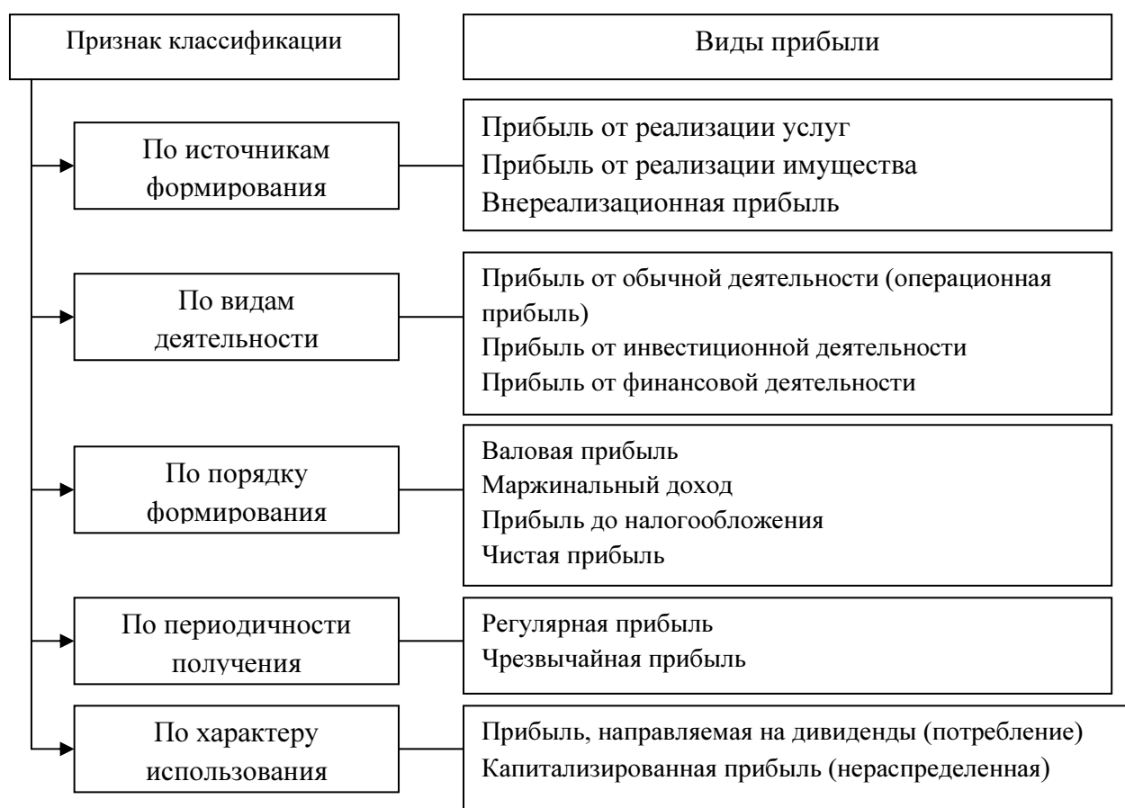
Рис. 2 Классификация прибыли

Внешнее проявление сущности прибыли выражается в таких показателях, как: прибыль до налогообложения; валовая прибыль; прибыль от реализации (продаж); прибыль от обычных видов деятельности; внереализационная, операционная и чрезвычайная прибыль; налогооблагаемая прибыль; чистая (нераспределенная) прибыль; нормальная прибыль; экстремальная, монопольная, экономическая, бухгалтерская, маржинальная, глобальная, экстремальная, оптимальная, консолидированная, предпринимательская и другие виды прибыли.