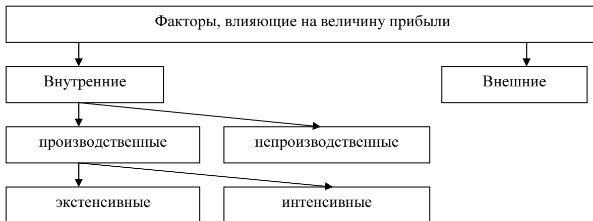
Рис. 3 Классификация факторов, влияющих на прибыль

К внешним факторам относятся природные условия, государственное регулирование цен, налоговых льгот, тарифов, процентов, штрафных санкций и т.д. Эти факторы не зависят от деятельности фирмы, но могут оказывать значительное влияние на величину прибыли.