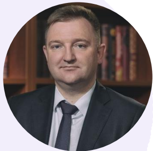
Александр Бугаев Первый заместитель Министра просвещения Российской Федерации

В ходе выступления на Международном форуме министров образования «Формируя будущее» (8 июня, Казань)