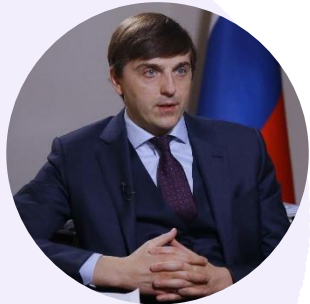
Сергей Кравцов Министр просвещения Российской Федерации

В рамках встречи на Международном форуме министров образования «Формируя будущее» (10 июня, Казань)