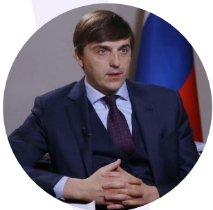
Сергей Кравцов Министр просвещения Российской Федерации

«Россия имеет мощный образовательный потенциал, сильные педагогические и научные школы. За последние 20 лет в нашей стране проведена модернизация всей системы образования. И такая работа, донастройка образовательных программ постоянно продолжается с учётом растущих запросов молодёжи, стремительных общественных, экономических, технологических изменений в мире и, конечно, тех новых масштабных задач, которые мы решаем в рамках национальной повестки развития»