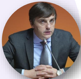
Сергей Кравцов Министр просвещения Российской Федерации

В ходе встречи с Президентом России Владимиром Путиным (9 января, Москва):